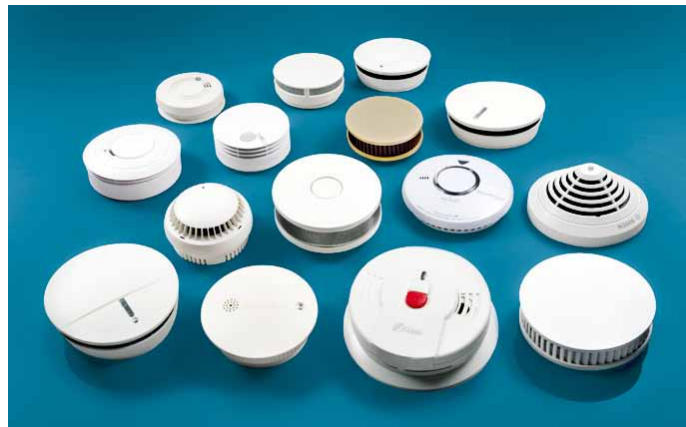
Abb.: Auswahl Rauchwarnmelder verschiedener Hersteller

Die Notstrom-Option gewährleistet eine einwandfreie Funktionsbereitschaft auch bei Stromausfall. Qualitativ hochwertige Melder arbeiten weitestgehend wartungsfrei.